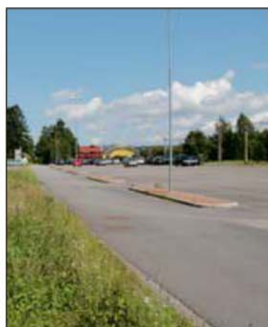
KJØPTE I 2005: Tomta vis-à-vis parkeringsplassen ved Fet stasjon ble kjøpt av firmaet i 2005.

– Det er tatt høyde for alle aldersgrupper. Og vi tror de fleste husstander kan klare seg med en bil med bakgrunn i kommunikasjonsstilbud i nærheten. Halvparten av leilighetene bygges som treroms, 30 prosent som fireroms og 20 prosent med to rom. Småbutikker i kioskstørrelse er planlagt i 1. etasje.